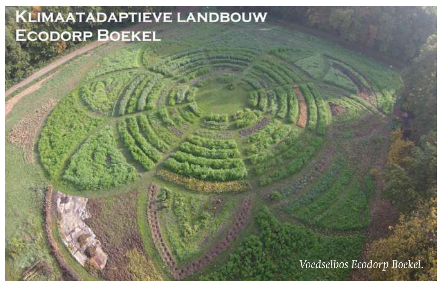
Voedselbos Ecodorp Boekel.